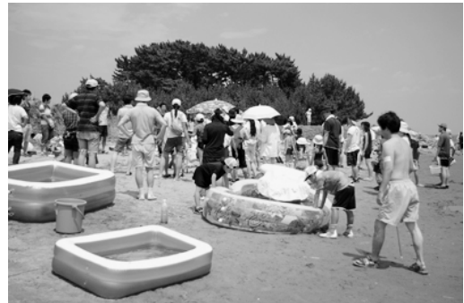
図1 蒲生干潟(仙台市)で開催した「体験型自然科学の教室」の様子。自然の中にそれぞれの研究者が実験ブースを設置。参加者らは思い思いの場所で活動する。

究テーマ設定のきっかけとなることもあった。もちろん2時間程度の教室でやれることは限られているため、継続実験のようすや成果報告は、ウェブサイト上で随時公開する形態 4) をとっている。